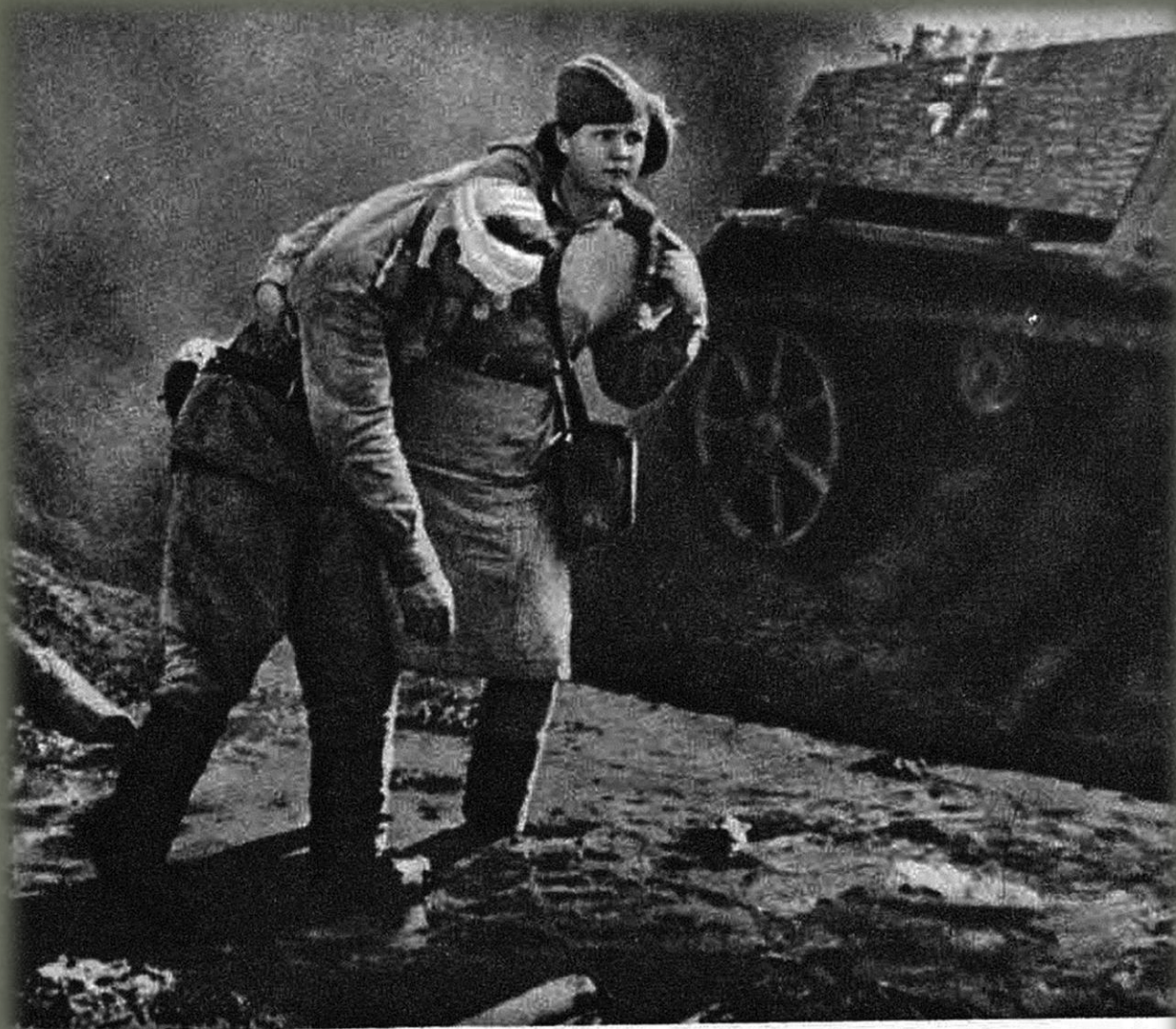
Спасая раненого война...

Многих солдат спасли от смерти добрые женские руки.