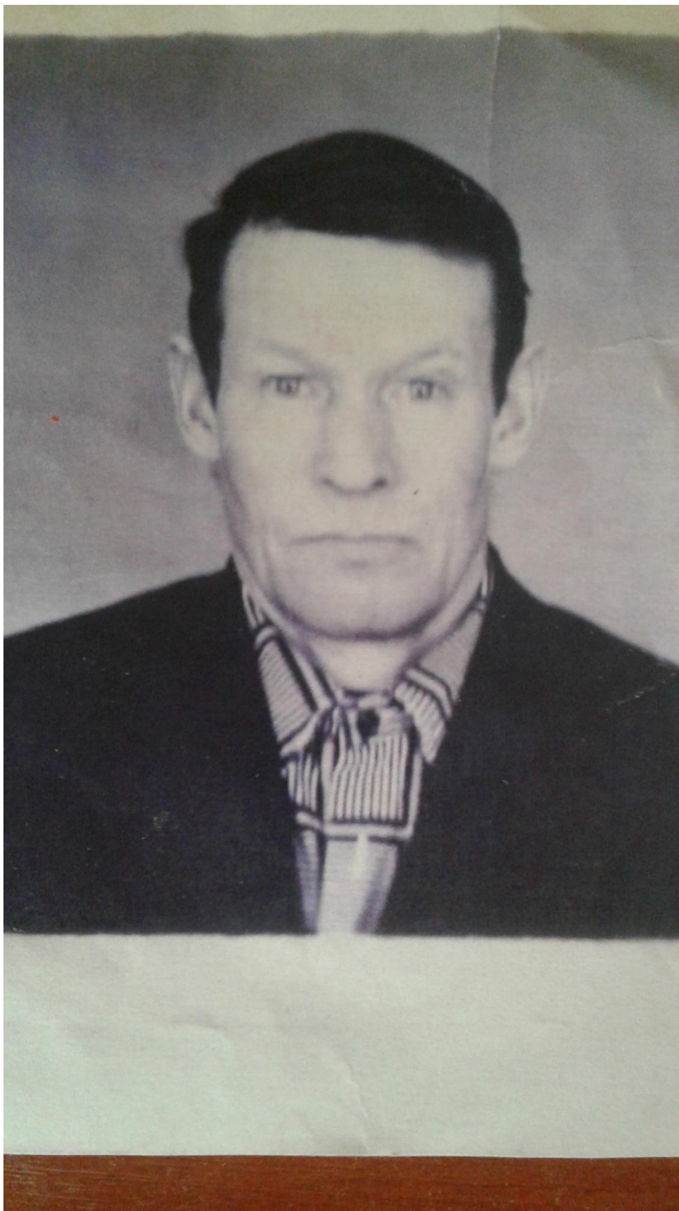
Шилов Михаил Иванович. (1924 – 2006)