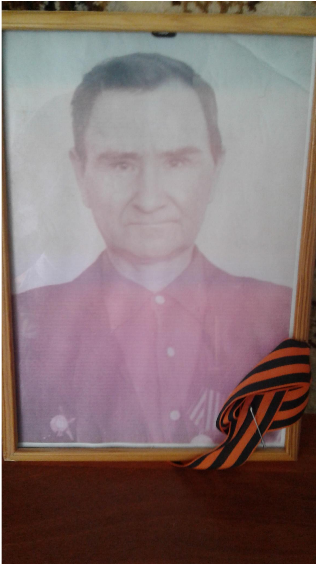
Веревкин Алексей Яковлевич (1909 – 1977)