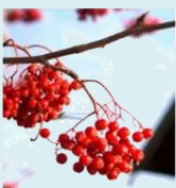
Ягоды рябины и калины