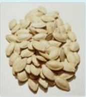
Семена тыквы и дыни