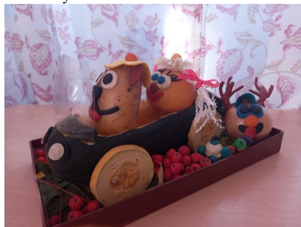
«Веселые Смешарики» Полина Б.