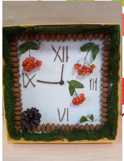
«Лесные часы» Лиза С.