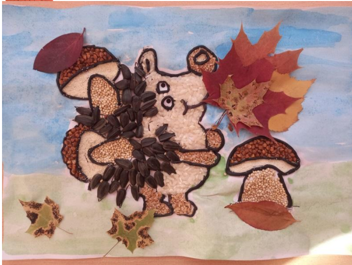
«Запасливый Ежик» Лиза Т.