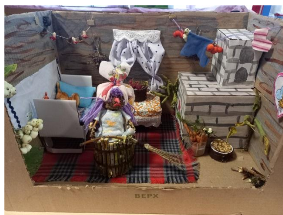
«Запасы Бабы-Яги» Вера Б